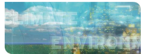
KIT-Zentrum Klima und Umwelt: Für eine lebenswerte Umwelt